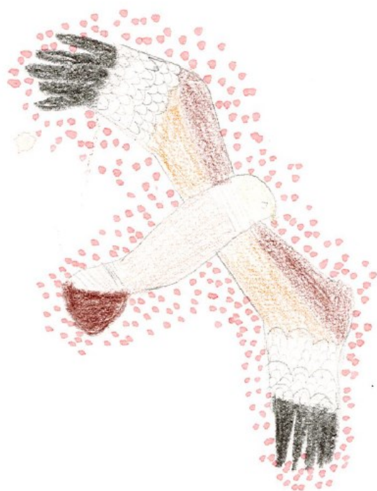
Croquis de buse variable