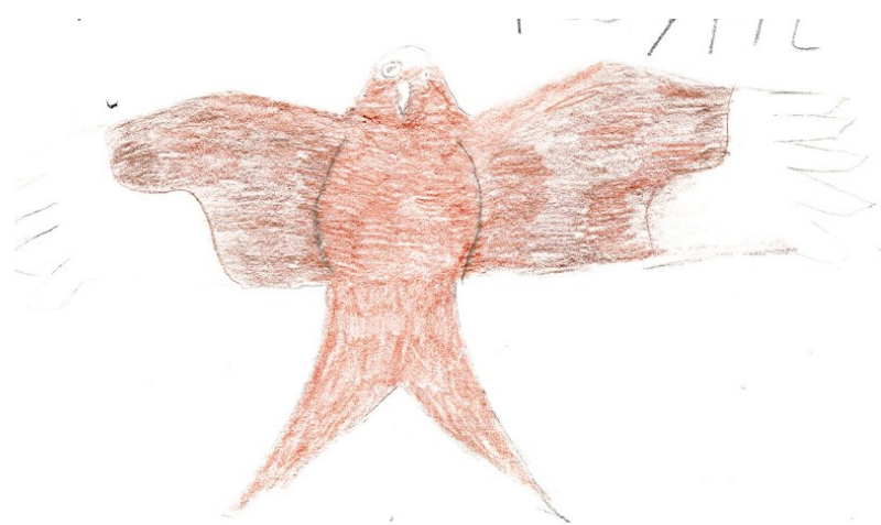
Croquis de milan royal

Plus tard, nous avons retravaillé dessus et nous avons fini les croquis que nous avions pas fait lors de la sortie. Pour finir, nous avons choisi un oiseau à peindre à l'aquarelle.