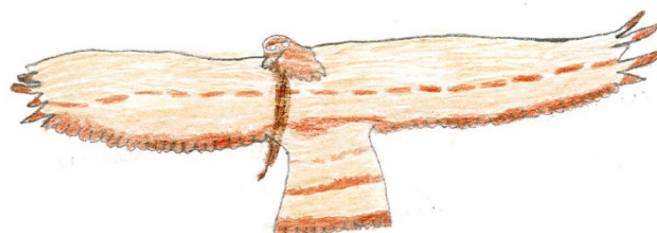
Croquis de circaète Jean-le-Blanc