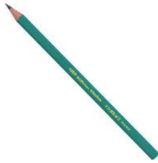
Un crayon à papier