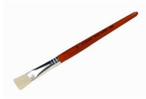
Un pinceau à colle