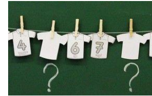
Maillots de 1 à 10 10 bouchons numérotés

peux inscrire les nombres de 1 à 10 sur des bouchons!). Tire un nombre dans le sac et trouve le maillot correspondant. Vérifie en retournant le tee-shirt s'il s'agit du même nombre. Si tu as réussi, tu gagnes 1 point. Remplace le jeton dans le sac et recommence jusqu'à avoir retourné tous les tee-shirts. Compte le nombre de points que tu as gagnés.