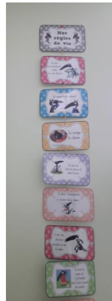
Nos règles de vie de classe

-Nous avons des responsables du jour (qui changent chaque semaine), pour distribuer le matériel, faire passer la poubelle/ le tri au besoin (travaux de découpages). Nous avons des responsables de la date, météo (binôme MS / GS). Il y a également un « chef de rang » et un « facteur ». Nous avons mis en place également un calendrier permettant de comptabiliser les jours « travaillés ». Nous ferons un goûter de fête le 100 ème jour !