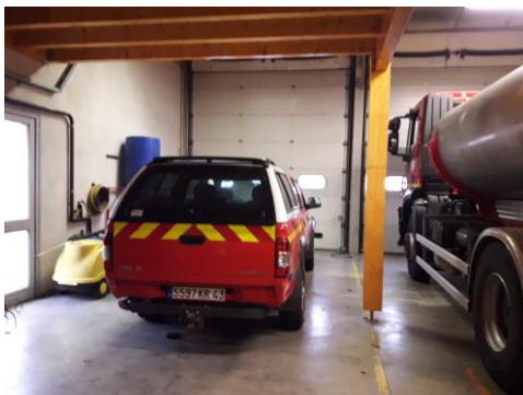
La voiture légère tout-terrain (V.L.T.T.) qui peut tracter la moto-pompe.