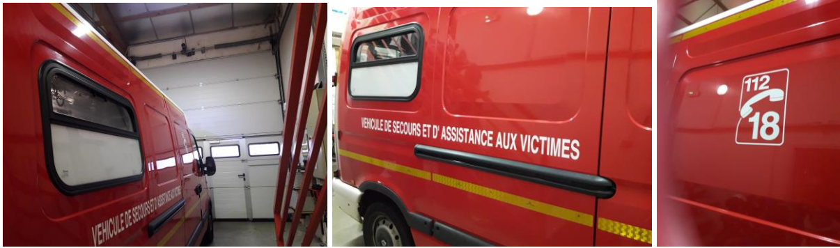
Le 18 ou le 112 : numéro unique européen !!