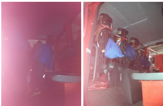
A tour de rôle, les élèves ont pu monter dans le camion d'interventions pour observer l'intérieur.