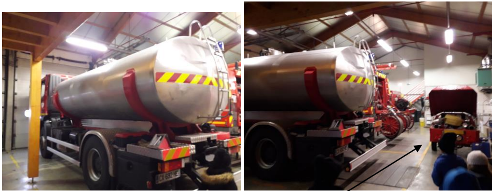
Le camion citerne et la moto-pompe remorquable... pour aspirer l'eau de la rivière.