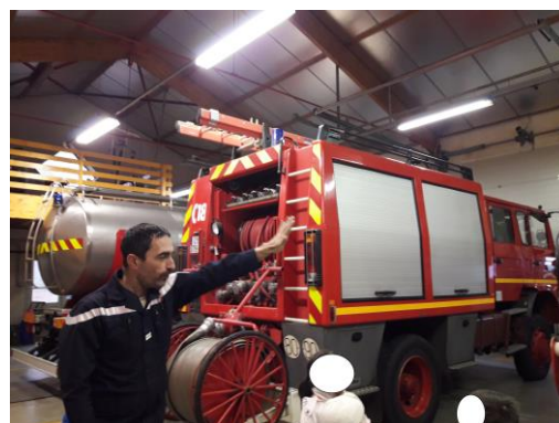
Un camion pour les feux de bâtiments