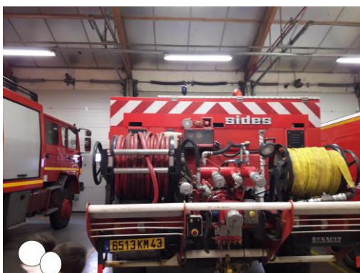
Un camion pour les feux de forêt...