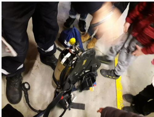
Un A.R.I. (appareil respiratoire Isolant)