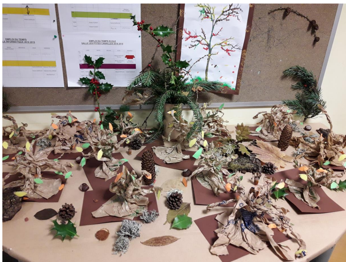
Arbres en papier (GS)