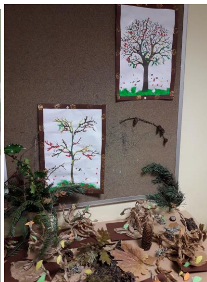
Peinture au coton tige